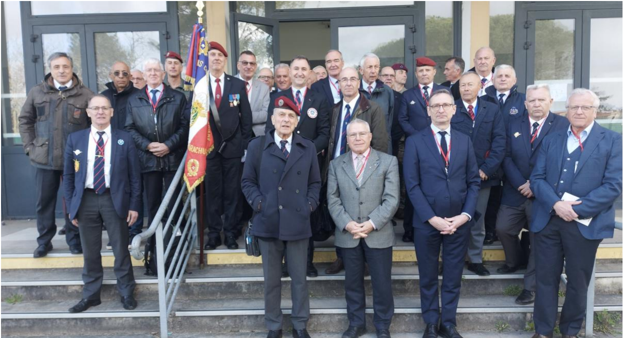
Les présidents et le CA