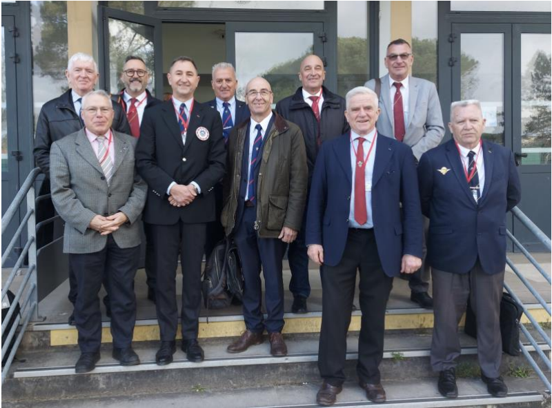
Le conseil d'administration