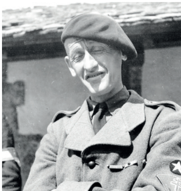
▲ Le célèbre guide Armand Charlet porte sur sa manche, l'étoile d'éclairer-skieur et l'insigne de l'AS ainsi que ses barrettes de décoration sur la poitrine.