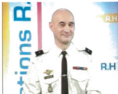
Général Philippe PONTIES

est complété par un dispositif publicitaire sur la presse gratuite et sportive (les plus lues par les jeunes), ainsi que sur le web, via les sites de puissance (Type Facebook), affinitaires (type You tube) ou bien de recrutement (type Monster). Des espaces publicitaires sont également présents sur les jeux vidéo à l'exclusion des jeux de guerre ou de violence afin de ne pas créer d'amalgame entre la virtualité des situations créées par ces jeux et la réalité de la guerre. Ce dispositif les jeunes vers le site internet ultra moderne et à très haut degré d'interactivité (également accessible en site mobile) afin de les inviter à se faire par eux-mêmes une idée du métier, de ses réalités et de ses contraintes, puis à se diriger vers le centre d'information et de recrutement des forces armées (CIRFA) le plus proche pour un entretien avec un conseiller en recrutement, étape indispensable sur le parcours du candidat à l'engagement.