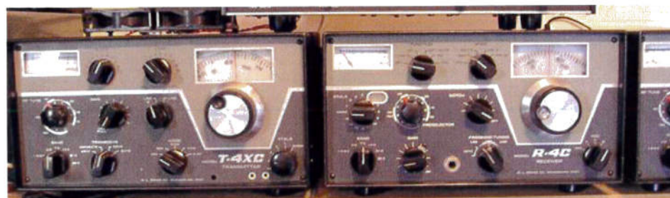
Émetteur DRAKE 200w avec ampli HF 1Kw, récepteur DRAKE et récepteur de trafic EYSTONE

Les liaisons seront multiples : Favières, Kinshasa, Lubumbashi, Kamina. Tant avec le commandement de l'opération qu'avec les anten-