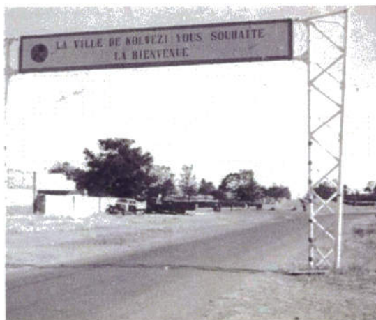
Entrée de KOLWEZI