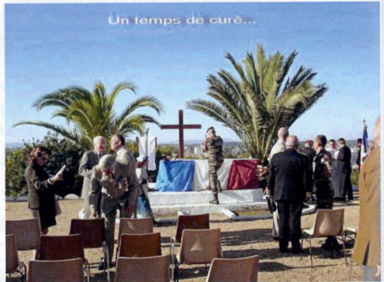
Un temps de curé...

Les plus vaillants d'entre nous se replièrent dans l'après-midi vers « la chapelle » bien décidés à rejouer « la maison de la dernière cartouche ». Là dans une ambiance conviviale, entre deux chants paras, ils continuèrent à distiller l'amitié et à refaire l'armée française jusqu'au soir. Les « palois » les premiers, s'apercevant soudainement qu'ils n'habitaient pas là, donnèrent le signal du départ et nous quittâmes avec regret cette chaude ambiance en nous donnant rendez vous l'année prochaine pour une nouvelle St Michel. Merci encore au 1°RPIMa et à son chef de corps de nous avoir invité et d'avoir fait de cette St Michel 2007 une nouvelle journée inoubliable. E.J.