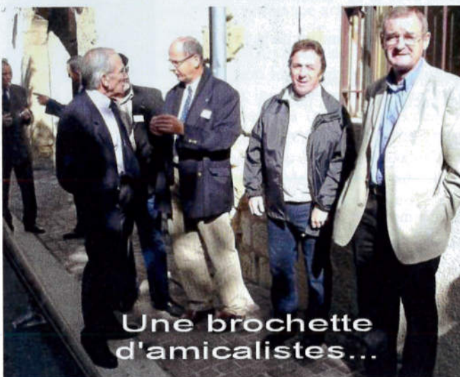
Une brochette d'amicalistes...