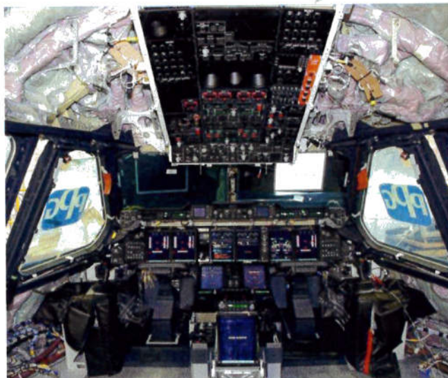
Vue intérieure du poste de pilotage