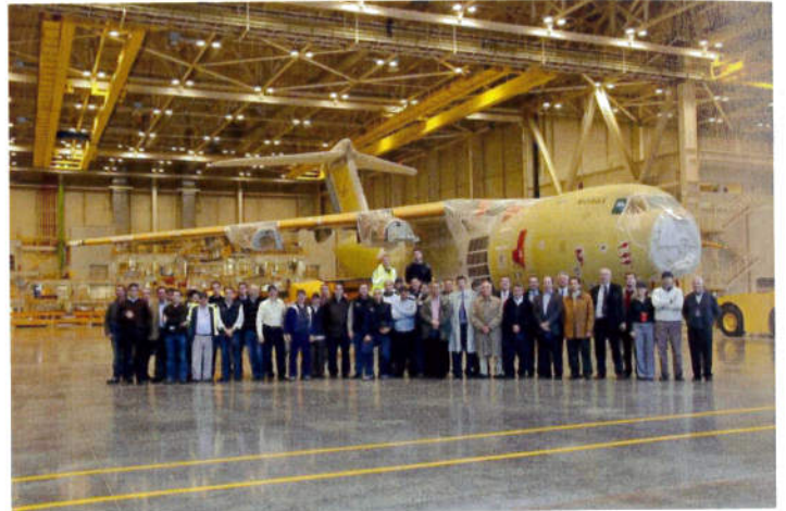
Le premier exemplaire de l'A400M, non encore motorisé, dans les hangars de Séville