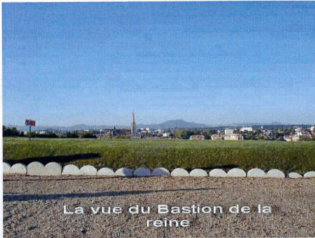
La vue du Bastion de la Reine

Comme tous les ans nos camarades colos du 1°RPIMa nous avaient invités à célébrer notre saint patron dans les murs de ce bijou architectural de Vauban, haut lieu des paras colos : La citadelle Gal Bergé.