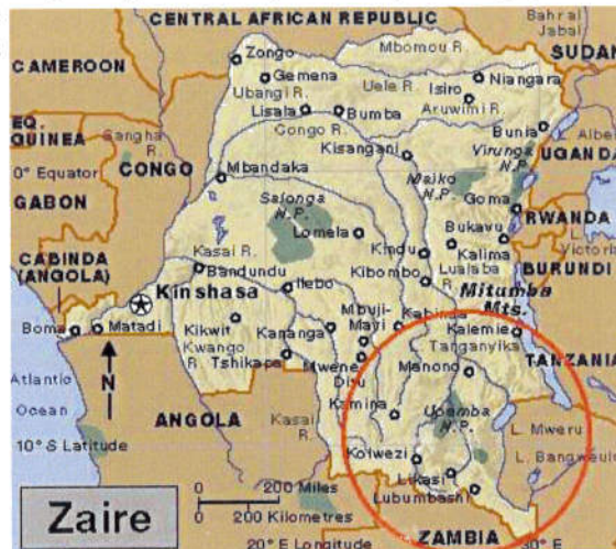
L'Ex Congo belge : ZAIRE Au sud, KOLWEZI

Face à cette situation et devant l'indécision des autorités belges, le président Valéry Giscard d'Estaing décide de faire intervenir le 2ème REP. Le vendredi 19 et le samedi 20 mai le régiment saute en deux vagues sur la ville qui sera rapidement libérée.