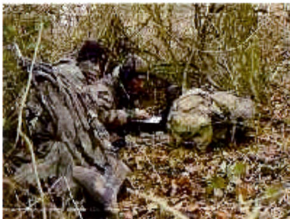
Radios en action

Après les événements dramatiques du 11 septembre 2001, il a été décidé une réorganisation du format des forces spéciales françaises, se rapprochant du modèle américain. Ainsi, les structures de commandement des forces spéciales vont évoluer, cela s'est traduit par l'apparition de groupements de forces spéciales (GFS) alors dotés de PC de niveau brigade. Dans cette logique, la BFST a vu le jour en 2002 avec l'intégration du 13ème RDP de Dieuze au sein de cette brigade. Depuis cette date, la BFST est alors composée du 1er RPIMa de Bayonne, du 13ème RDP, du DAOS (Détachement ALAT des Opérations Spéciales) et d'un état-major basé à Pau. EM dont la mission opérationnelle est d'armer un ou plusieurs PC de GFS. Ensuite, s'est posé le problème des liaisons entre ces PC de GFS et les unités subordonnées, l'idée d'une création d'une Compagnie de