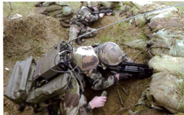
Le PR4G à dos d'homme