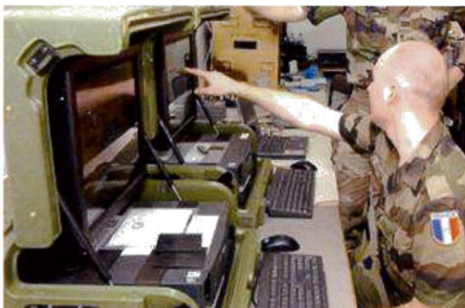
Au PC, le Système Information de Commandement