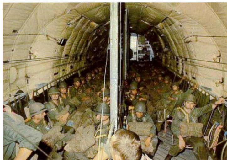
Dans la soute du Transall....