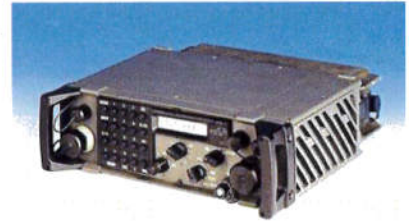
PR4G version portable