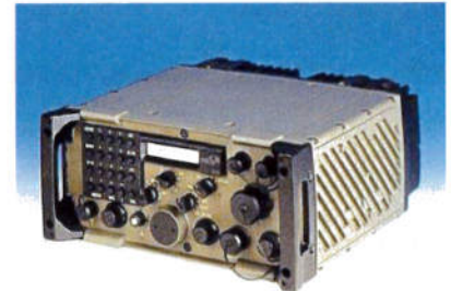
PR4G version véhicule