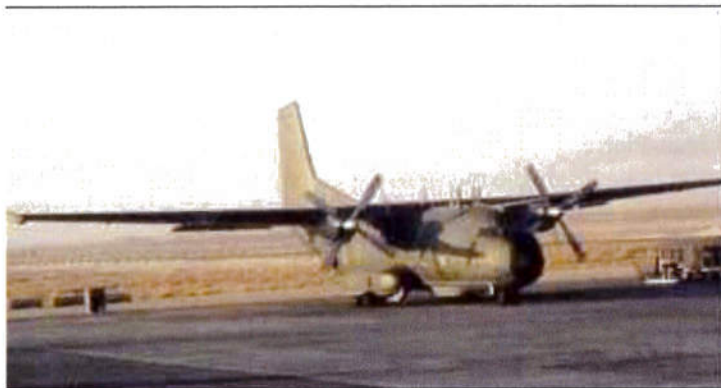
Le Transall C160 « Gabriel » spécialisé dans la guerre électronique

Trois prototypes furent construits et le premier vol d'un Transall s'effectua le 25 février 1963. Ensuite, six appareils de pré-production pour les programmes d'essais furent construits et volèrent en 1965, puis c'est au printemps 1967 que la production de 169 appareils commença pour s'achever en 1972. 110 C160 D Allemand sont livrés dont 20 revendus à la Turquie, qui reçut 20 C-160 D, (Qui seront appelés C160 T), 50 C160 F pour la France. D'autres pays furent intéressés par l'appareil, et c'est ainsi que l'Afrique du Sud reçut 9 C-160 Z. A la fin des années 70, la France décida de ré-ouvrir la chaîne de production pour produire 25 exemplaires du C-160 NG (Nouvelle Génération) qui possédait une capacité en emport carburant accrue, et une meilleur avionique. Le C-160 NG reçut une perche de ravitaillement en vol, ce qui permit d'augmenter très largement son rayon d'action. Durant les années 90, tous les avions de série F (France) subirent des modifications de leur avionique et devinrent R (rénovés). Le C-160 Transall est un appareil de transport à moyen rayon d'action et moyenne charge. Sa configuration alaire (ailes hautes, et ailes extrêmes à dièdre positif de 160m 2 ) et son train d'atterrissage (8 roues principales et 2 auxiliaires basse pression) robuste lui permettent de décoller et d'atterrir sur des pistes courtes et sommairement aménagées. Il est également capable d'opérations tactiques comme la navigation en très basse altitude.