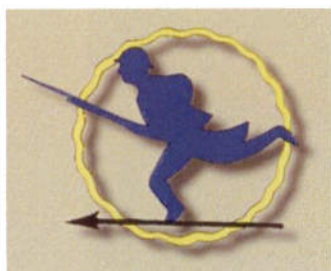
601ème Groupe d'Infanterie de l'Air