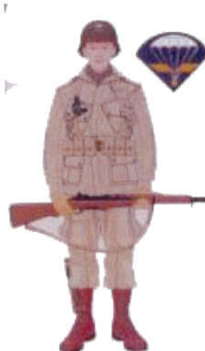
Para du 1er RCP 1944-45