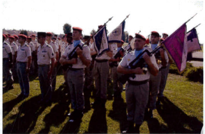
Les fanions, on reconnaît celui de la 342ème CT, 61ème BCT, 61ème BTAP, CIT 25