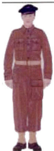
Para 1ère Cie Inf de l'Air Londres 1941