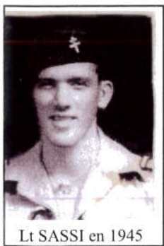
Lt SASSI en 1945

Il continuera à s'investir comme Président de l'Amicale des Anciens du 11 ème Para Choc pendant de longues années.