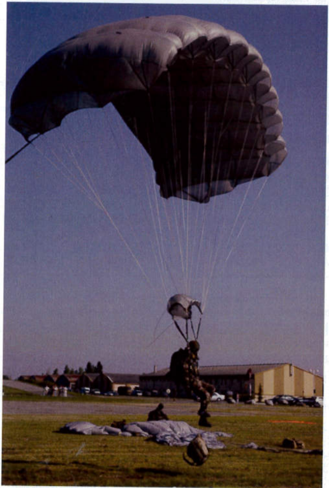
Un Commando Para de la 11ème CCTP à l'atterrissage