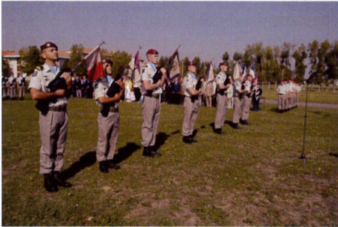
Les fanions des unités dissoutes lors de l'évocation historique.