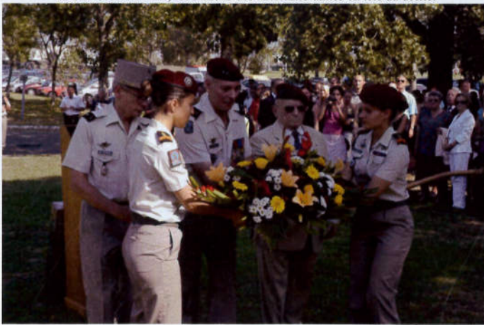
Dépôt de gerbe à la stèles des Transmetteurs Paras