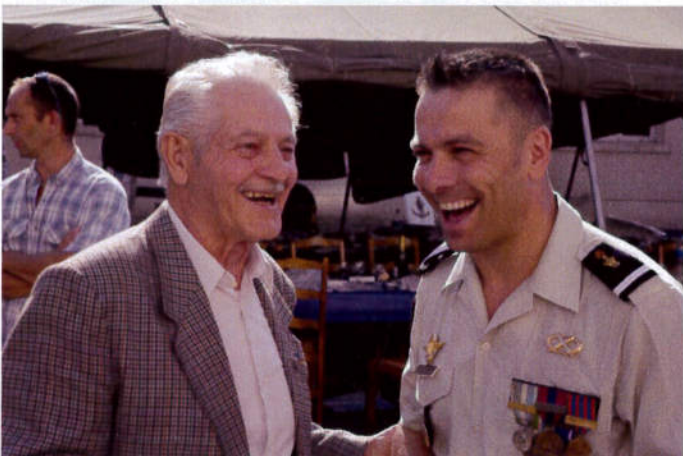
Histoires de moniteurs.....l'ambiance est bonne.