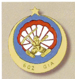
602ème Groupe d'Infanterie de l'Air