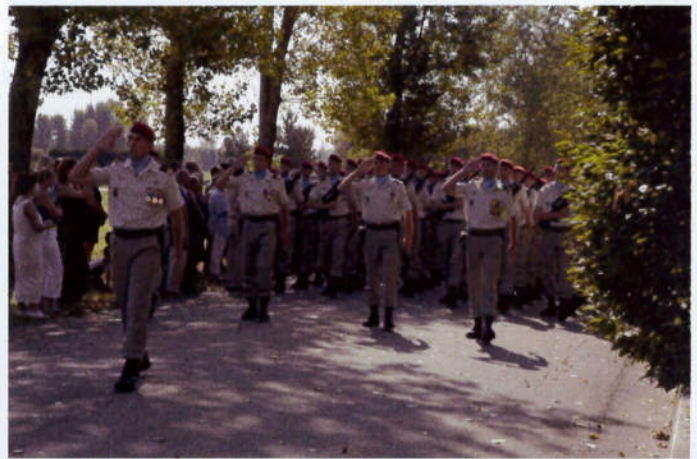
La 11ème CCCTP.....impeccable.