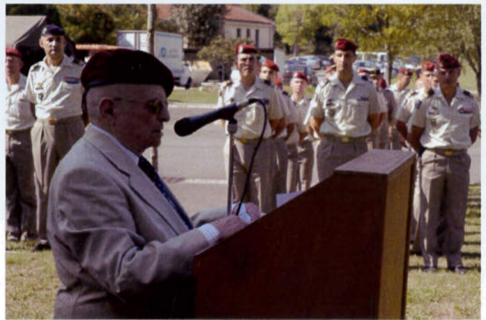
La saga des aéroportés Français devant la stèle