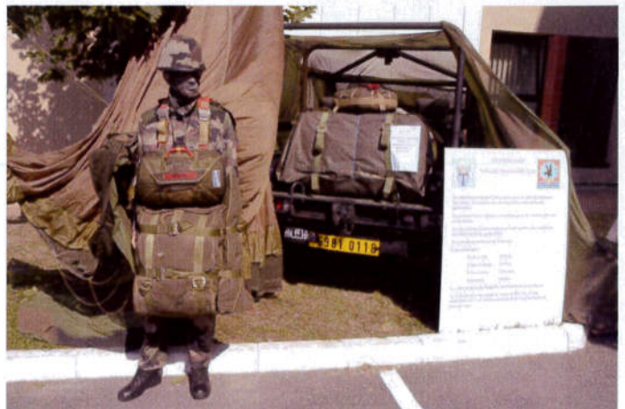
Stand des Commandos Paras