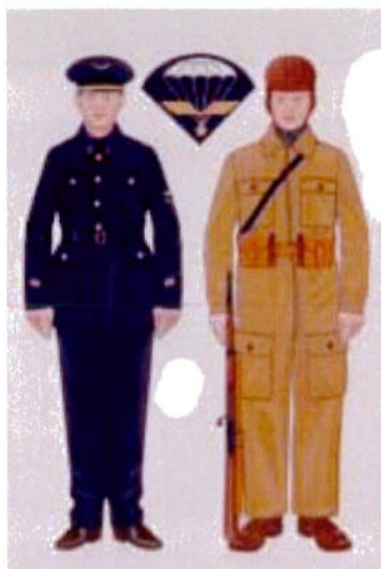
Para du 601ème GIA Tenue de service et tenue de combat