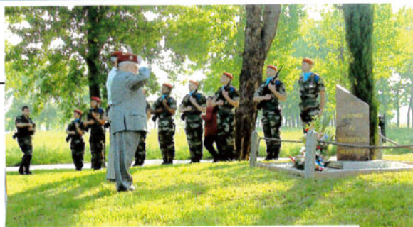
Dépôt de gerbe à la stèle des Transmetteurs Paras au Quartier Balma Ballon

Toujours disponibles, bon nombre de camarades jouaient même les prolongations en dînant ensemble. Ils étaient, pour la plupart, déjà présents la veille au soir à l'hôtel KY-RIAD et au restaurant Courtepaille de Balma où avait eu lieu le repas d'accueil et d'amitié présidé par le général ABADIE.