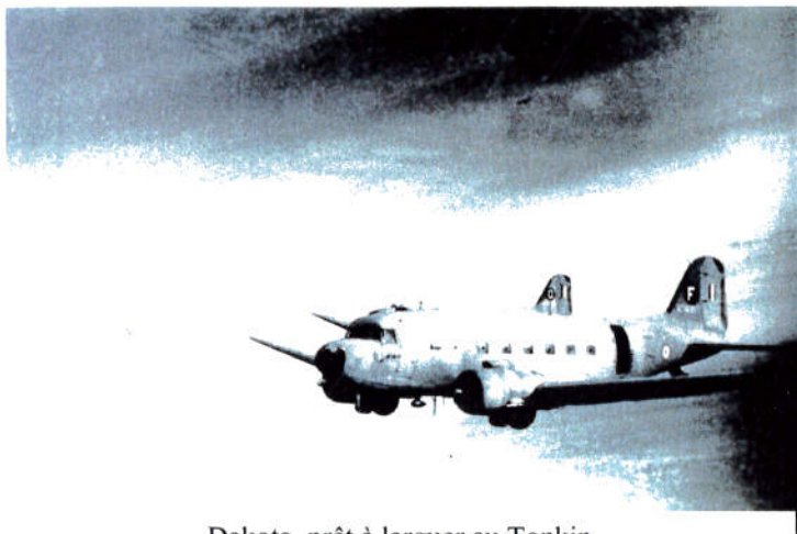
Dakota, prêt à larguer au Tonkin