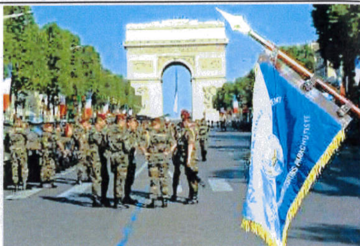
Derniers préparatifs avant le défilé, le fanion de la 11 ème CCTP sur les Champs-Élysées