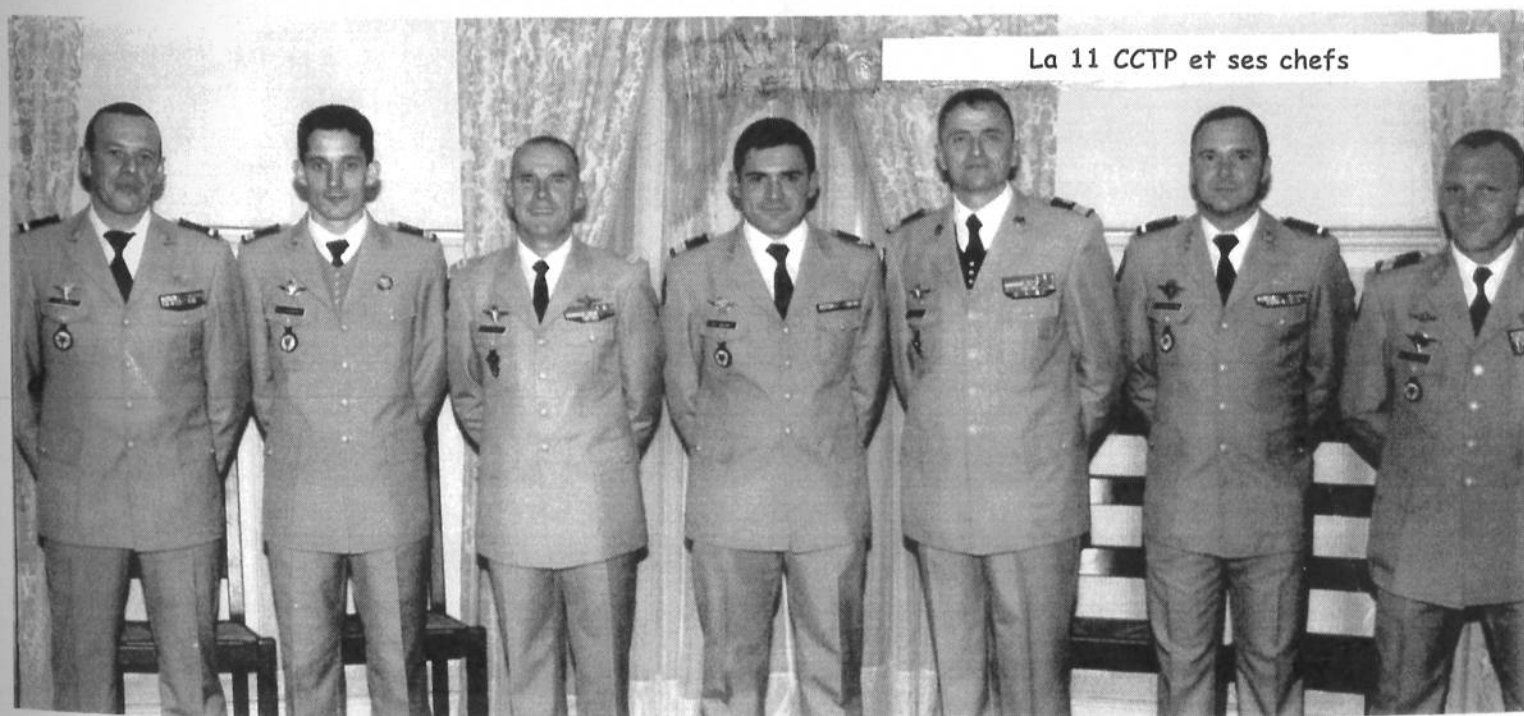
La 11 CCTP et ses chefs

Cette pièce contribue au devoir de mémoire.