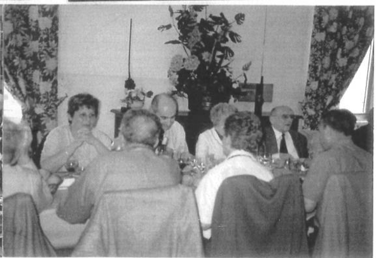
Le 12 Mai 2001 à Agen