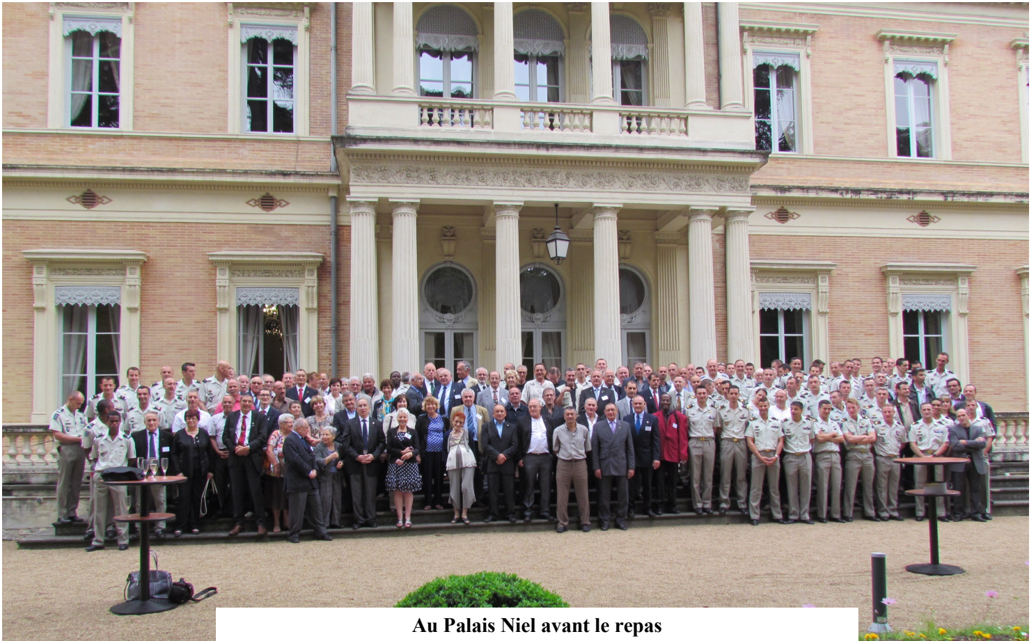
Au Palais Niel avant le repas