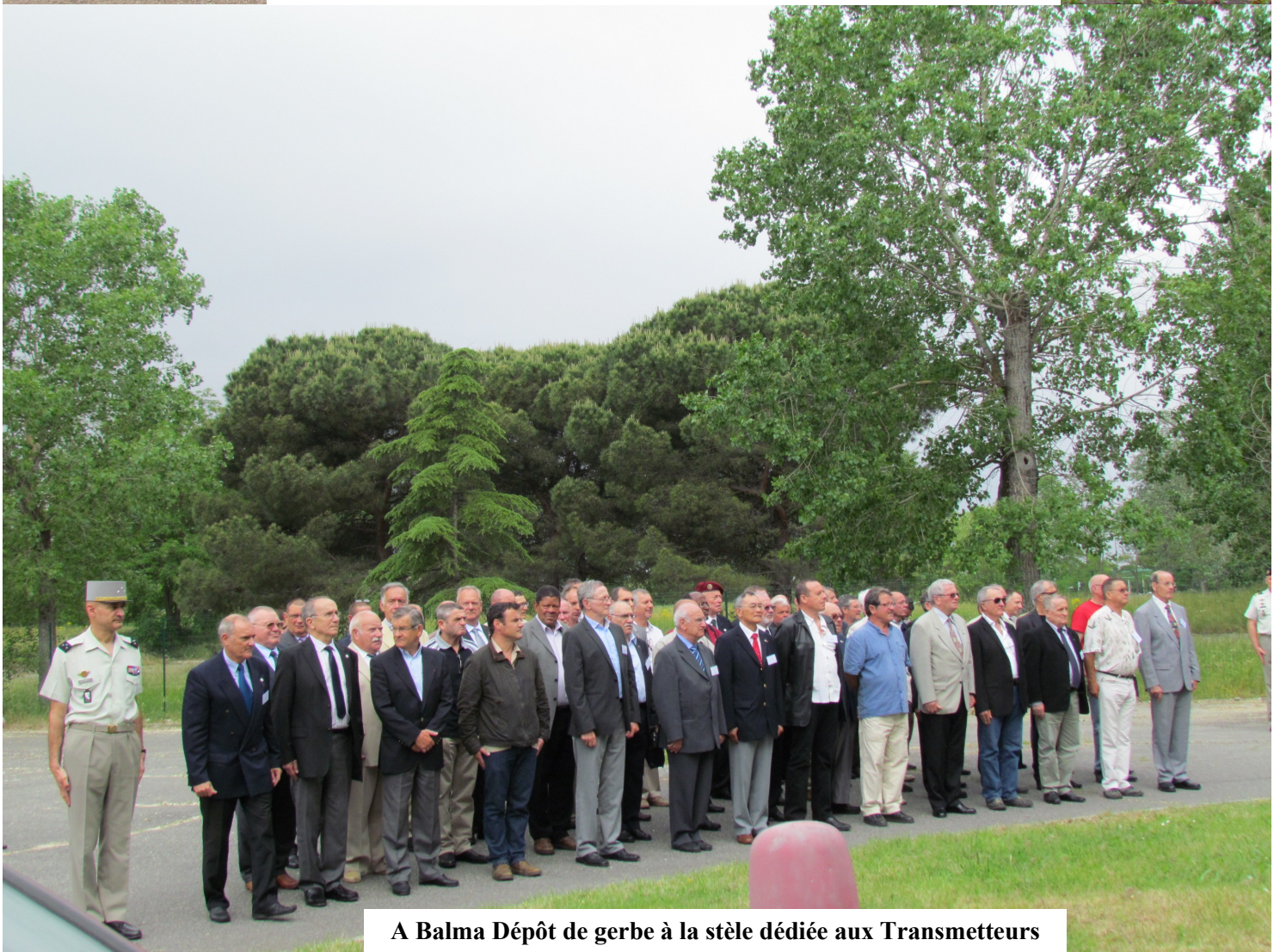
A Balma Dépôt de gerbe à la stèle dédiée aux Transmetteurs