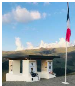
Environ 200 personnes attendues.

Cet évènement a obtenu le LABEL MISSION LIBÉRATION de l'État