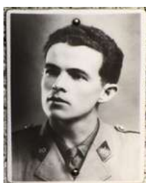
« Officier d'une exceptionnelle valeur morale, animé du plus bel esprit de sacrifice... »