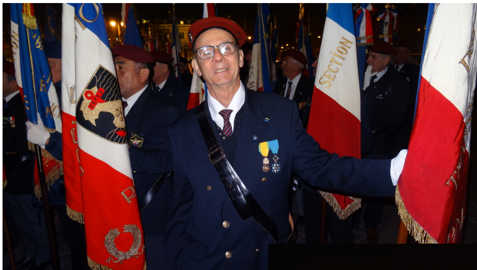
Notre porte-drapeau représentait l'ANATAP