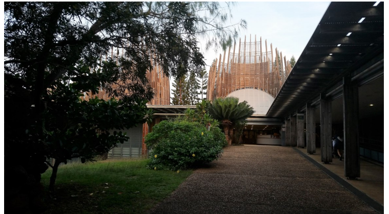
Espace Culturel TJIBAOU

Cet exercice constitue un rendez-vous majeur pour chacun de ces participants et une occasion unique d'entraîner les forces armées du Pacifique Sud à grande échelle.