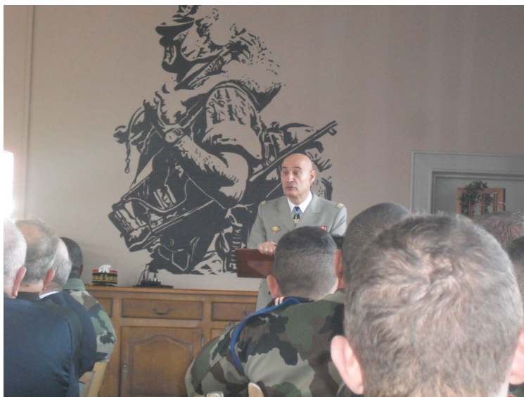
Discours du GCA PONTIES devant une assistance attentive