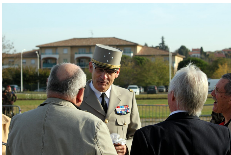
Le temps des retrouvailles...