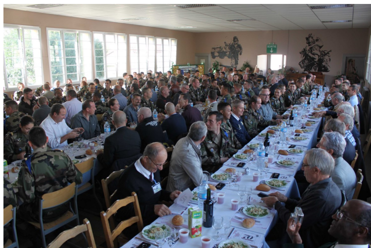
et ... des agapes