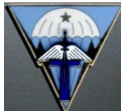
CCT BFST Pau