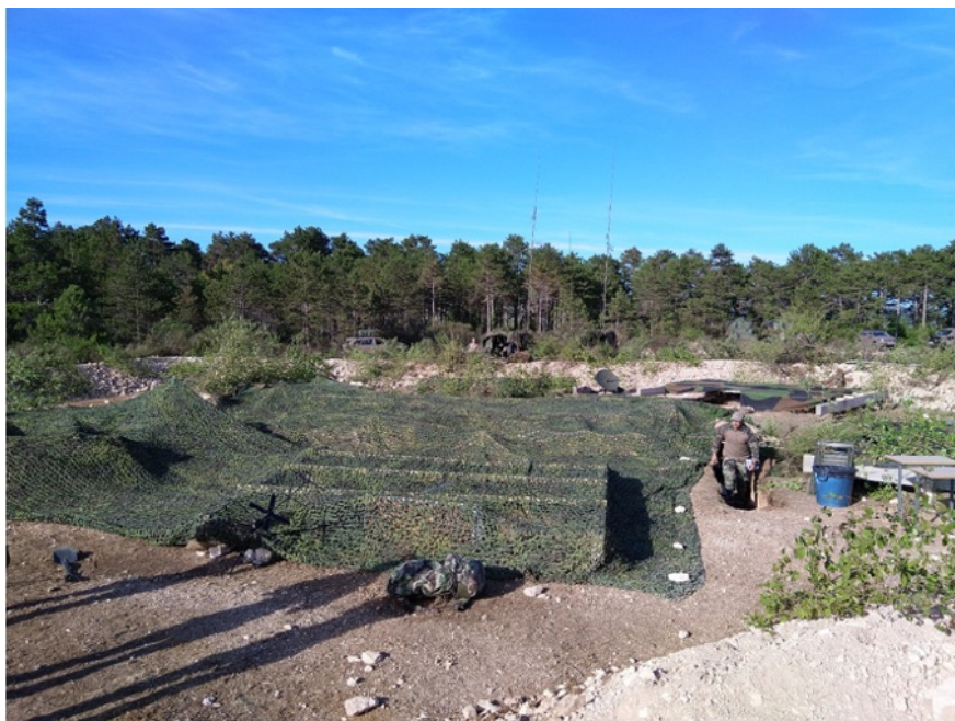
PC G08 déployé en exercice.

La 11 e CCTP arme de manière permanente l'Echelon National d'Urgence (ENU) à travers un détachement à 27 transmetteurs (le DET 27) qui est une partie intégrante du PC aérolargable « G08 ». La mission du DET 27 est d'établir les liaisons avec les unités déployées et de livrer un PC capable de durer.