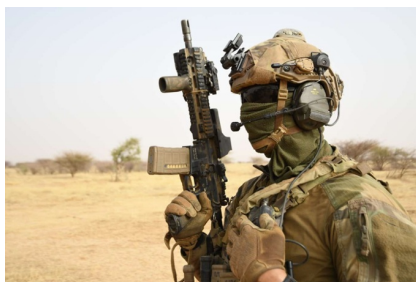
Membre équipe GCP 11 e CCTP déployé au Mali