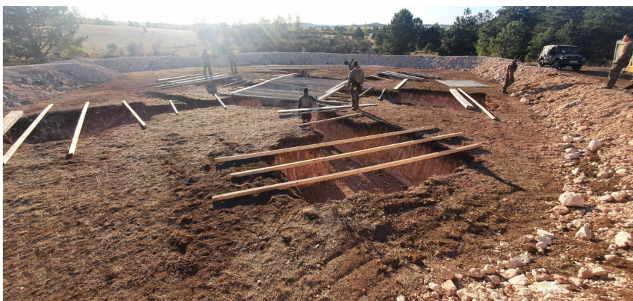
Camouflage du PC G08

Dans un contexte où l'Ukraine est venue confirmer le retour du combat à haute intensité, la 11 e CCTP poursuit sa préparation opérationnelle pour travailler son interopérabilité dans la profondeur du champ de bataille